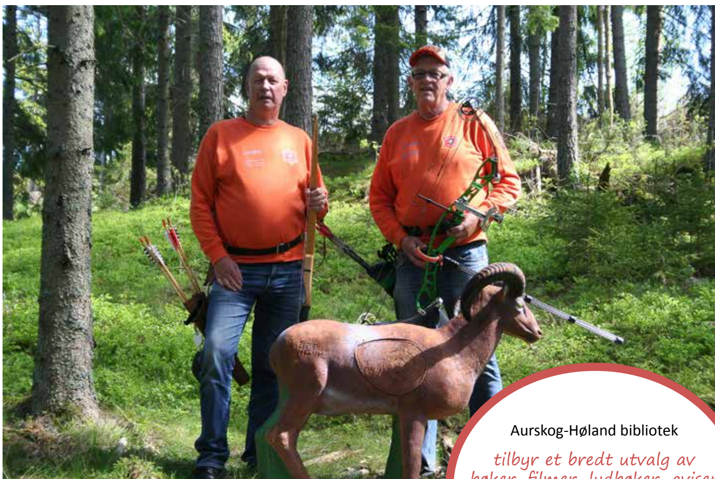
Det er aldri for sent å starte med bueskyting. Finstadbru bueskyttere har flere medlemmer som har startet i voksen alder, og gjør det godt på stevner. Det er mange muligheter, uansett alder.

tet er godt for alle, uansett alder. FYSÅK er et tilbud til deg som vil komme i form og muligens trenger litt hjelp for å komme i gang. Å motivere innbyggerne i Aurskog-Høland kommune til økt fysisk aktivitet, for dermed å kunne bidra til bedre helse, er mantraet. Fysio- og ergoterapitjenesten har også styrke- og balansegrupper. Trening er god forebygging, en får overskudd og blir i bedre humør av å bevege seg. I tillegg er det hyggelig i fellesskap. Vi gleder oss til å trene sammen med deg sier fysioterapeutene til oss.