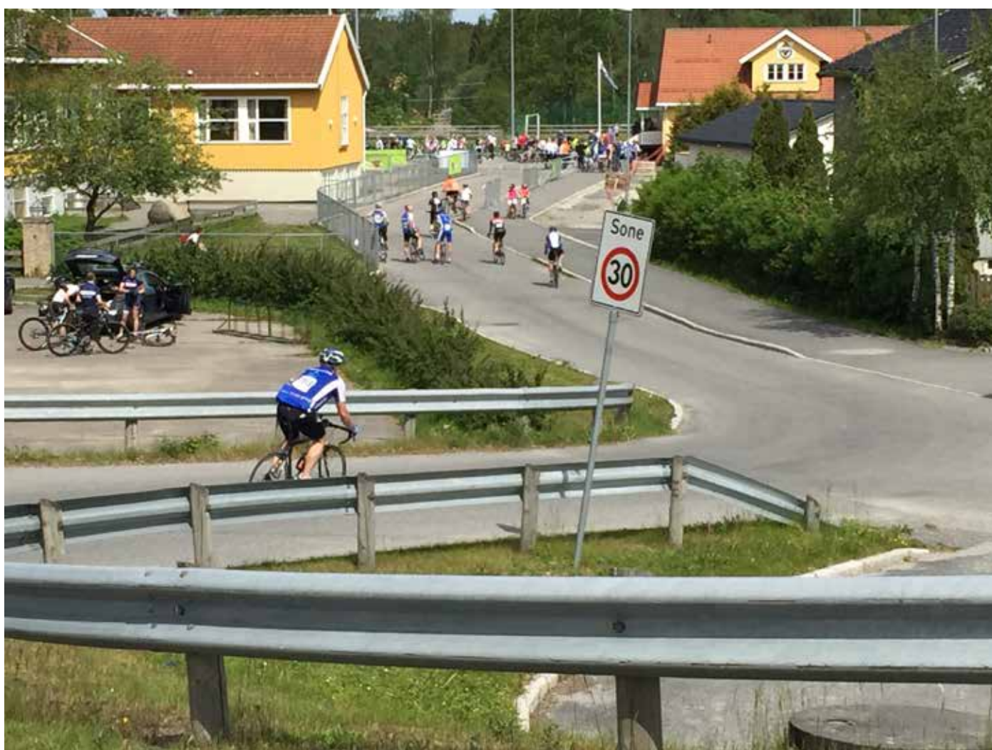
Fra Krepserittet på Hemnes i 2015. Bli med neste gang? Det er muligheter for alle, enten om man vil sykle eller være frivillig. Det er også andre sykkelarrangementer rundt i kommunen.

Aurskog-Høland Røde Kors trenger også frivillige og her kan du bruke litt av din tid for andre. Mer informasjon på www.rodekors.no . Er det egentlig noe mer meningsfylt i livet enn å hjelpe andre? Det er også muligheter i sanitetsforeningene og idrettslagene blant annet. Bli med på laget du også. Alle kan delta uansett alder. Du finner mer informasjon på www.ahk.no .